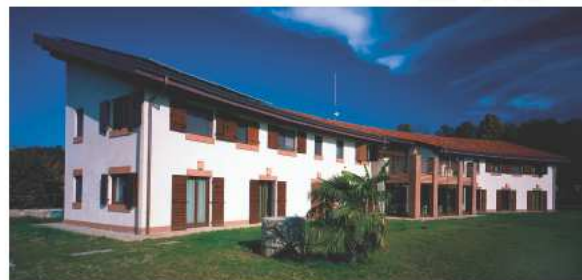
Aval, Un gioiello di bioarchitettura premiata con la bandiera della FEE Italia, perché pienamente in linea con i parametri del programma GREEN HOME, per lo sviluppo sostenibile.

L'ACELLULOSA , raggiunge valori d'isolamento termico acustico più elevati rispetto a tanti altri materiali conosciuti dall'edilizia convenzionale.