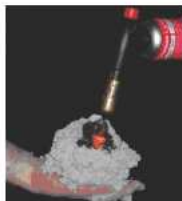
Prova di resistenza al fuoco

Grazie a queste caratteristiche la resistenza al fuoco, delle costruzioni insufflate con LACELLULOSA , risultano di livello superiore, rispetto agli altri isolamenti, a base di fibre minerali.